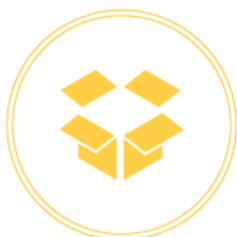
DIVISIONE INDUSTRIA ED IMBALLAGGIO