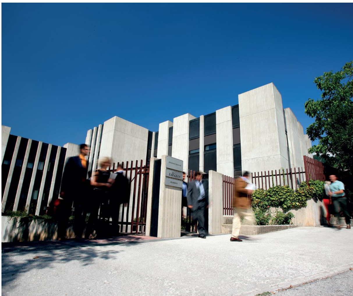
Figura 2 - Colacem, Direzione Generale - Gubbio (PG)

Colacem SpA è una realtà industriale attiva nella produzione di cemento.