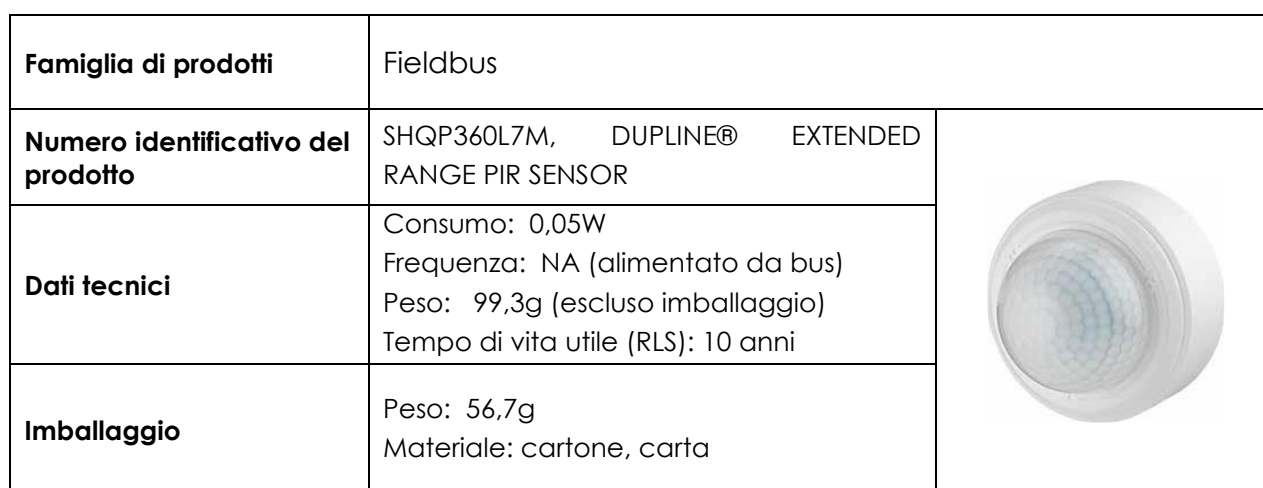
Tabella 2. Informazioni relative al prodotto SHQP360L7M

Il prodotto finito viene inviato ai vari centri logistici Gavazzi per la successiva distribuzione.