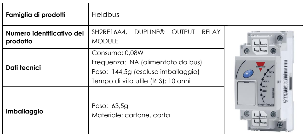
Tabella 2. Informazioni relative al prodotto SH2RE16A4

Il prodotto finito viene inviato ai vari centri logistici Gavazzi per la successiva distribuzione.