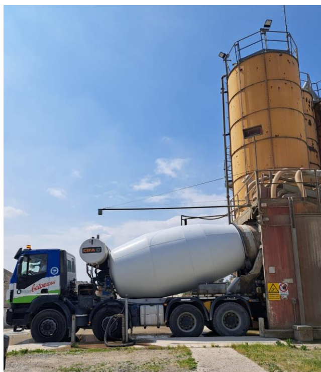
Stabilimento di Cernusco sul Naviglio