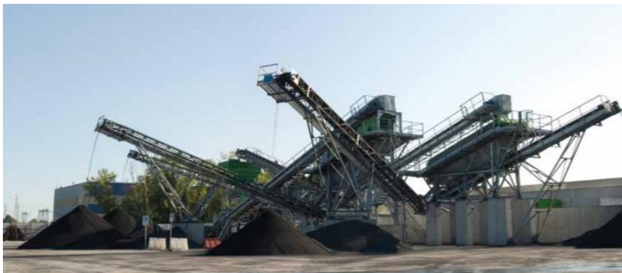
Figura 1: Stabilimento ZEROCENTO Riviera Francia (PD).

A maggio 2013 è stata ottenuta la certificazione di sistema controllo ambientale ISO 14001 con certificato n° 50 100 11966.