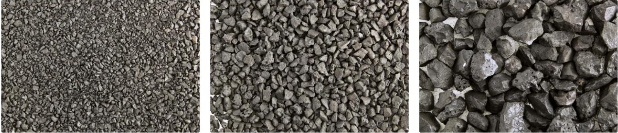
Figura 3: IPERGRIP– Aggregato artificiale.

Questo prodotto è adatto ad essere utilizzato negli ambiti in cui è necessario impiegare un aggregato tenace e performante come il basalto. Le prestazioni del materiale aggregato artificiale sono superiori rispetto al materiale naturale (LA<14, CLA 55), il costo è molto inferiore, e viene rispettata a pieno la nuova normativa sui CAM. Tale prodotto è venduto nel mondo delle costruzioni, in particolare nel settore degli asfalti.