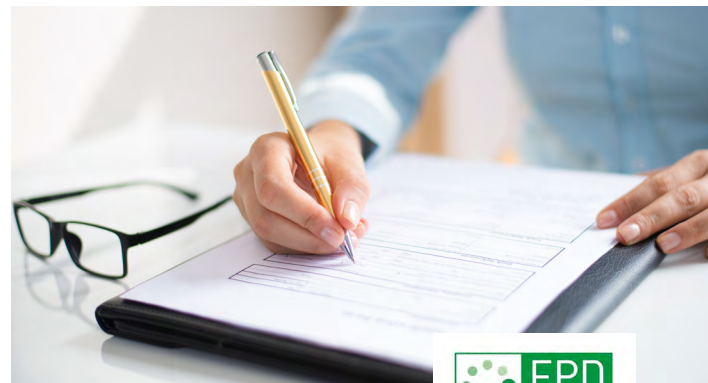
Program Operator italiano – EPDItaly

Ogni azienda, sulla base di uno studio del ciclo di vita ( Life Cycle Assessment – LCA ) di un prodotto o di un servizio, può redigere la propria dichiarazione di impatto ambientale. Solo a seguito di una verifica della correttezza e della congruità dei dati e dei processi, effettuata da parte di un organismo di terza parte indipendente accreditato, l'EPD viene pubblicata nel registro del Program Operator italiano – EPDItaly a disposizione del mercato nazionale ed estero in maniera trasparente e verificata.