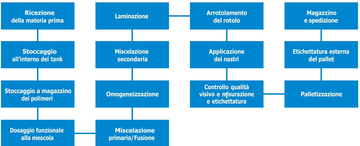
Figura 1 • Flow diagram per la descrizione processo produttivo.

confini che permettono di determinare i processi unitari da includere nel modello. Lungo tali processi unitari sono stati individuati i macro consumi coinvolti nella produzione dei prodotti e sui quali è stato impostato e analizzato il modello di calcolo. (Figura 1, Figura 3).