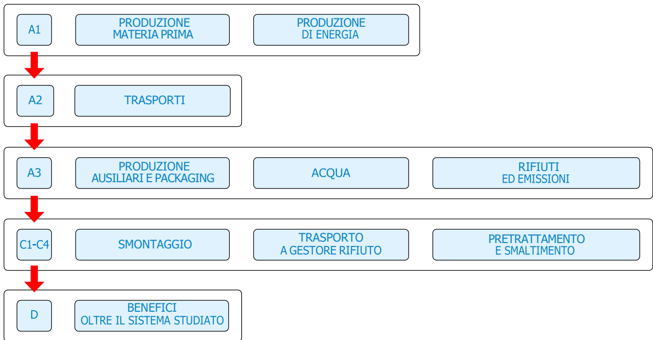
Figura 2 • Flow diagram per descrizione ciclo di vita con approccio modulare.