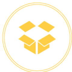
DIVISIONE INDUSTRIA ED IMBALLAGGIO