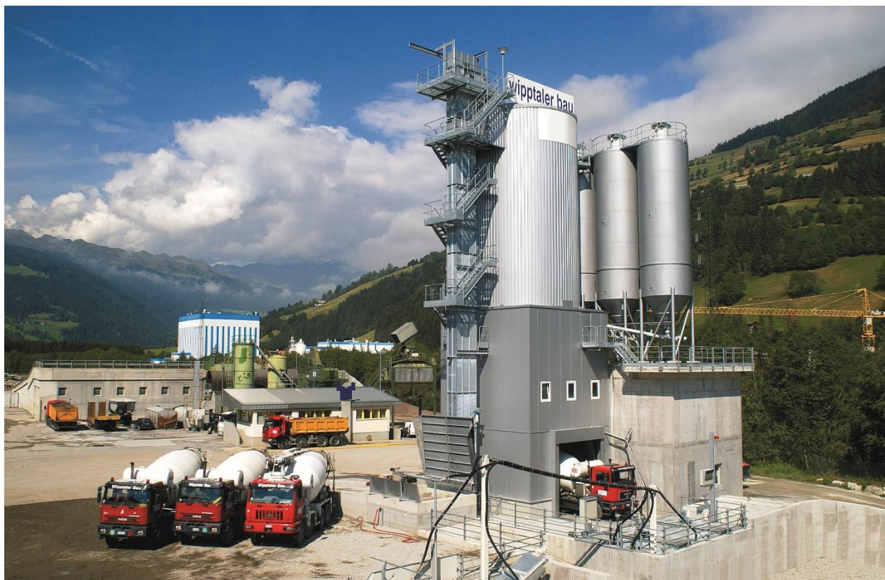
Stabilimento di Racines

Wipptaler Bau AG/Edilizia Wipptaler S.p.A. è una società che svolge sin dal 1972 la sua attività sia nel settore dell'edilizia pubblica, per la costruzione di strade e l'esecuzione di lavori di miglioramento, di movimento terra e opere infrastrutturali in genere, nonché qualsiasi attività nel settore dell'edilizia privata, sia per conto proprio che per conto di terzi.