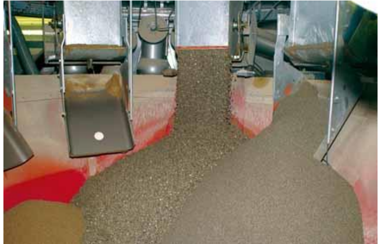
Caricamento inerti nel miscelatore

Gli inerti naturali necessari alla produzione di calcestruzzo sono reperiti dall'azienda presso la cava in concessione o attraverso operazioni di scavo e successivamente frantumati e vagliati nell'impianto di proprietà sito a Racines. Gli inerti sono poi stoccati secondo la suddivisione granulometrica. Gli inerti riciclati sono prodotti internamente a