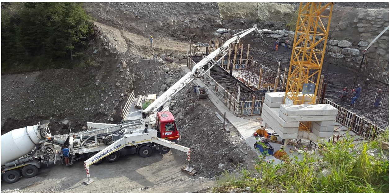
Getto del calcestruzzo con pompa

La produzione del calcestruzzo avviene all'interno di impianti di miscelazione della dimensione di 3 m 3 e il prodotto viene automaticamente scaricato nelle autobetoniere per il trasporto al cantiere. L'acqua impiegata per la produzione del calcestruzzo è parzialmente recuperata dalle operazioni di lavaggio delle autobetoniere di rientro, previa filtrazione.