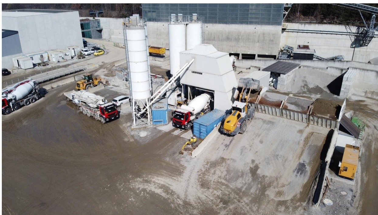
Stabilimento di Varna

Wipptaler Bau si trova a svolgere la propria attività in un contesto istituzionale, economico, politico, sociale e culturale nazionale e internazionale particolarmente articolato ed in continua evoluzione.