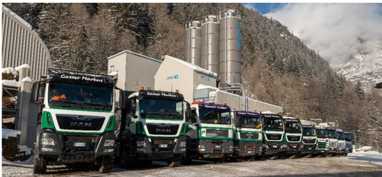
Impianto di calcestruzzo a Campo Tures

L'azienda Gasser Markus S.r.l. ha iniziato la sua attività il 1° aprile 1971. I primi lavori sono stati eseguiti con solo quattro operai e poche macchine. Negli anni seguenti il numero di dipendenti e il numero di macchine sono aumentati con continuità e nel 1990, è stato acquistato un terreno a Molini di Tures, su cui sono stati costruiti un magazzino e un capannone. Solo tre anni dopo, l'impianto di calcestruzzo è stato costruito e la produzione di calcestruzzo è stata registrata presso la Camera di Commercio di Bolzano. A quel tempo, la Gasser Markus S.r.l. era l'unica impresa edile della Val Pusteria che aveva una propria produzione di calcestruzzo. Poco dopo sono stati costruiti il nuovo capannone della fabbrica e l'edificio degli uffici. L'intera sede dell'azienda con gli edifici associati è stata ripetutamente ampliata e ricostruita nel corso degli anni e nel 2006 è stato ampliato anche l'impianto di betonaggio, con la realizzazione di un